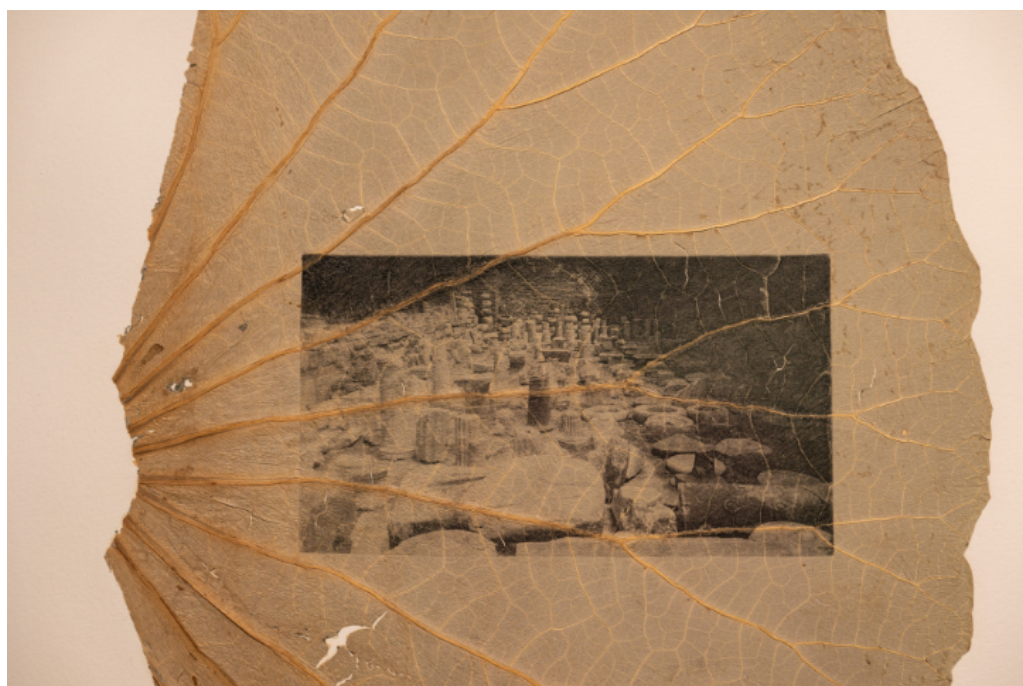
Benoît Billotte, Sous le pli , Ausstellungsansicht Dérive sous le pli des feuilles , Galerie Salon Vert, Foto Caroline Parodi

In seiner ersten musealen Einzelausstellung in der Schweiz schafft Benoît Billotte für das Kunst(Zeug)Haus einen Erlebnisraum, welcher die menschliche Beziehung zur Natur hinterfragt. Für seine Arbeiten sammelt er Statistiken, Karten, Pläne und Architekturen. Kulturelle Praktiken und historische Begebenheiten nutzt er, um Territorien, Landschaften und Räume zu untersuchen. Zudem werden Pflanzen und deren Verbreitung rund um den Globus zum Thema. Im Vordergrund steht bei Benoît Billotte stets der respektvolle und nachhaltige Umgang mit Materialien.