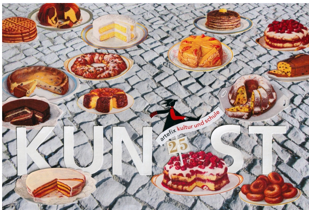
KunstTorte, Collage artefix kultur und schule

25 Jahre artefix kultur und schule – ein Jubiläumsprojekt in Rapperswil-Jona