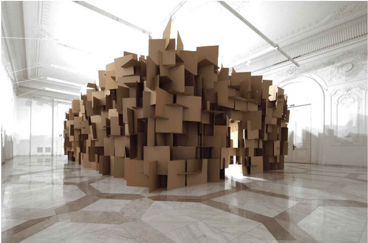
Zimoun, Zweifel 2011, 200 motors, 2000 cardboard elements

Der junge Installationskünstler Zimoun (*1977) ist bereits international bekannt für seine Installationen, die oft mit Klangkunst umschrieben werden.